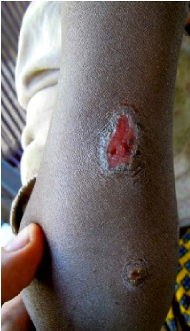
Fig. 2 Ulcération non croûteuse / Non-crusted ulcer

Les lésions cliniques les plus fréquentes étaient des ulcérations multiples/uniques non croûteuses (Fig. 2) ou croûteuses (Fig. 3) dans 28 (56 %) des cas. Les autres lésions étaient des cicatrices (13 %), un abcès (2 %), des plaies (4 %) ou autres (pyodermites, eczéma) [26 %].