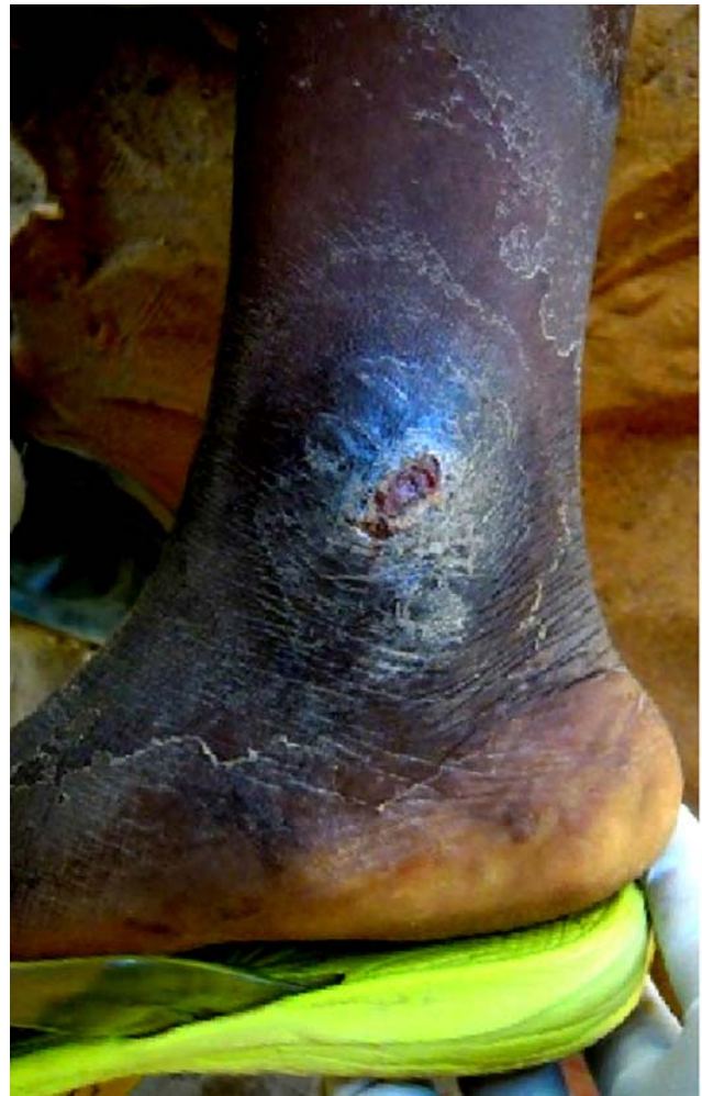
Fig. 3 Ulcération croûteuse / Crusted ulcer

Les ulcérations siégeaient essentiellement au niveau des parties découvertes : membres inférieurs 22/28 (78,6 %), membres supérieurs 2/28 (7,2 %), rarement la tête 3/28 (10,6 %) et l'abdomen 1/28 (3,6 %). Un cas de papule associé à une ulcération a été observé. Le nombre moyen d'ulcérations était de 1,89 (min : 1 et max : 6). La taille moyenne des ulcérations était de 2 cm (min : 1 et max : 4). La durée moyenne d'évolution au moment de l'investigation était 3,7 mois (min : 1 et max : 12).