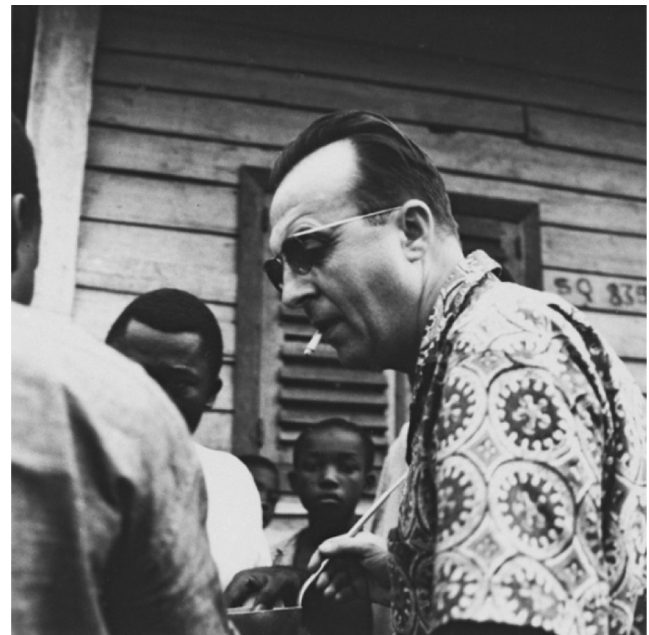
Fig. 1 Cameroun, 1975 – Enquête paludisme © IRD / Cameroon, 1975 – Malaria enquiry © IRD

Puis, porté par le goût de la découverte et du monde tropical, il abandonne un métier sûr et rémunérateur pour intégrer l'ORSOM (Office de la recherche scientifique outre-mer) en 1952. Cet organisme avait été créé par un décret du 11 juin 1942 et la loi du 11 octobre 1943 qui faisaient suite à la volonté exprimée en 1937 par le gouvernement Blum d'avoir un organisme capable de promouvoir la recherche dans les colonies françaises. L'Office de la recherche scientifique coloniale (ORSC) était né. Cette création sera confirmée par une ordonnance du gouvernement provisoire de la république française en date du 24 novembre 1944 et l'organisme changera rapidement de nom pour devenir en juin 1949 l'ORSOM puis l'ORSTOM (Office de la recherche scientifique et technique outre-mer) le