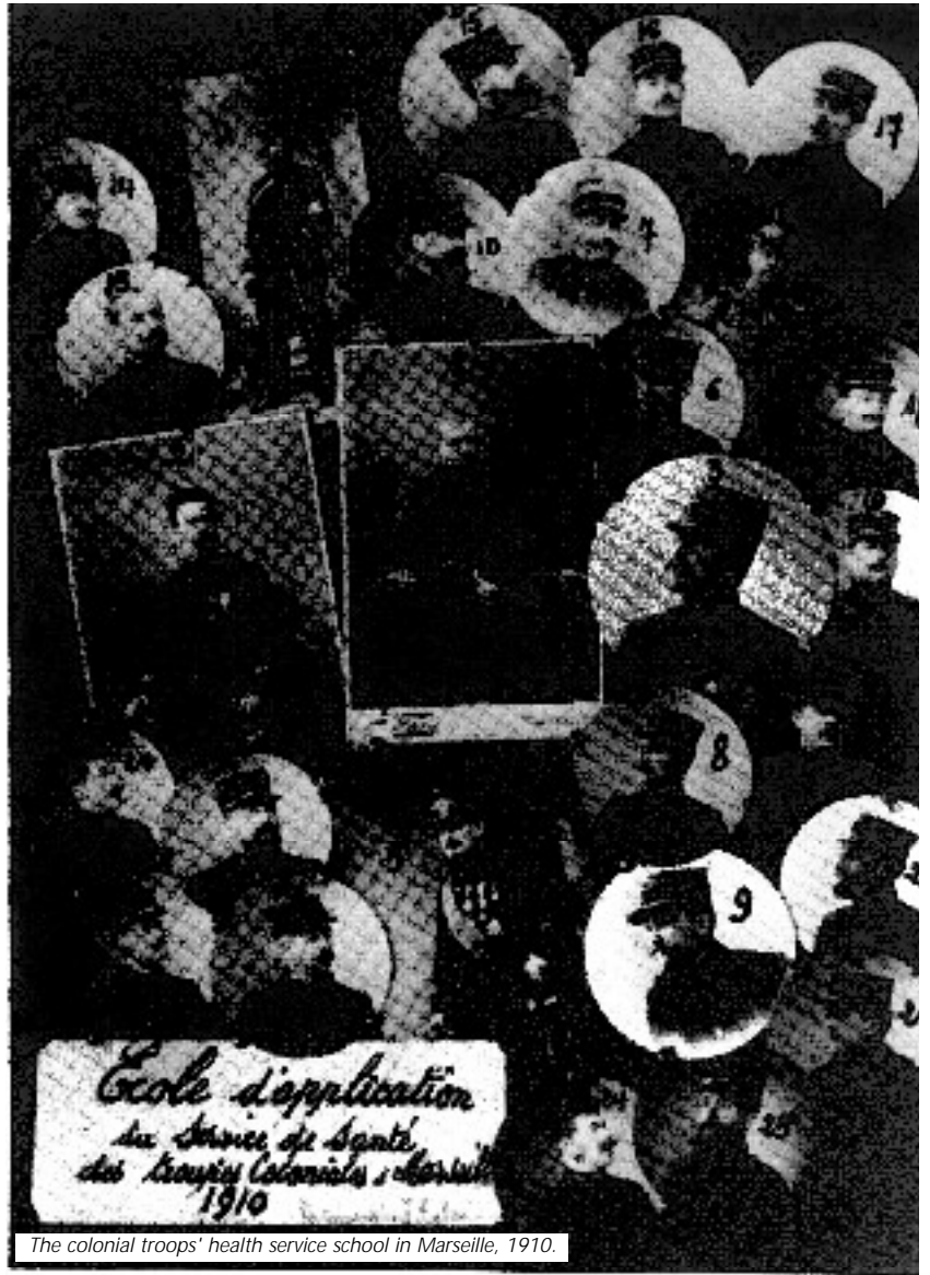
The colonial troops' health service school in Marseille, 1910.